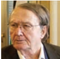
Ιωάννης Τσιάντης Καθηγητής Πανεπιστημίου Αθηνών

Τετάρτη 18 Φεβρουαρίου Ώρα 17:00 - 19:00