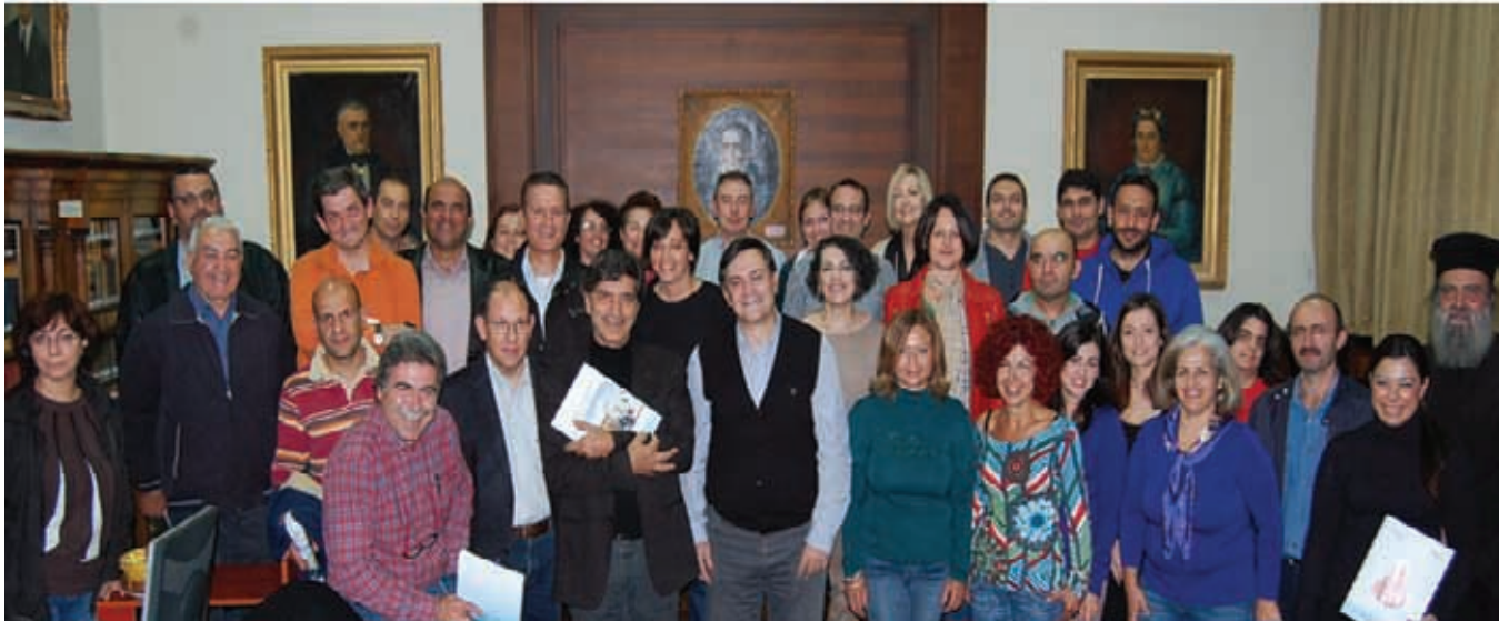
Από τον 1ο Κύκλο Σπουδών